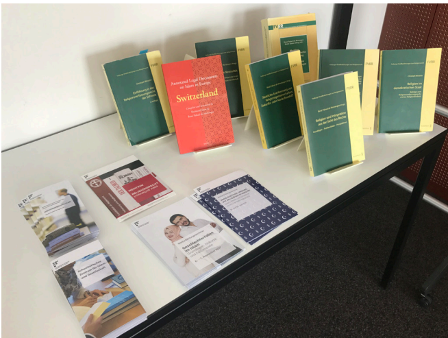
Auslagetisch am obengenannten Weiterbildungsseminar.

Die Mitarbeiter des Instituts wirkten als Referenten auch bei Weiterbildungsveranstaltungen anderer Anbieter mit, etwa im Rahmen einer Veranstaltung zum Thema „Rechtliche Rahmenbedingungen für Religion an der Schule“ an der Universität Luzern (Mai 2017), im Rahmen einer Weiterbildung zum Thema Seelsorge in Bundesasylzentren des Staatssekretariates für Migration in Bern-Wabern (Juni 2017) oder bei einer Einführungsvorlesung „Introduction to Swiss Law“ für ausländische Studierende an der Rechtsfakultät Freiburg i. Ue. (Oktober 2017).