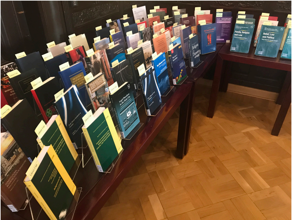
Auslagetisch in Halle (DE). Im Vordergrund 3 Bücher aus der Reihe der FVRR.

recht integriert werden. Eine andere Tagung war diejenige in Washington DC (USA), welche unter dem Titel „Comparative Law, Faith and Religion: The Role of Faith in Law“ stattfand. Auch hier konnten sich weit über 100 Wissenschaftlerinnen und Wissenschaftler zum Einfluss von Glauben im Recht austauschen, wobei B. Ramaj dem Publikum das diesbezügliche Beispiel Albaniens näherbrachte.