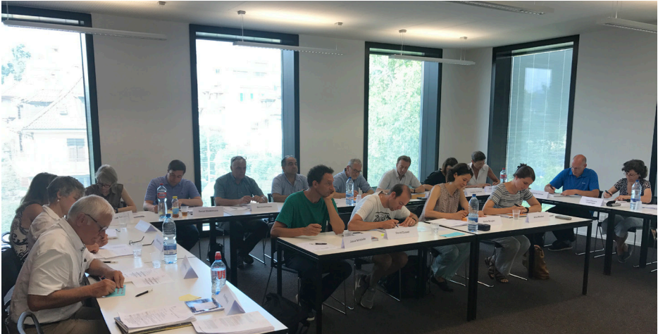
Die Teilnehmerinnen und Teilnehmer des Weiterbildungsseminars „Konstruktiver Umgang mit religiöser Diversität“.